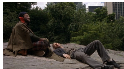
La leggenda del Re Pescatore (The Fisher King) Terry Gilliam, 1991

Jack, spregiudicato conduttore radiofonico provoca di sponda la morte della amatissima moglie di Perry, docente universitario. Un dramma che lo fa letteralmente impazzire. Ma New York è una grande mela dove i destini si possono anche incontrare e tra sensi di colpa e visioni di antichi cavalieri, c'è lo spazio per ricucire il senso della vita, e magari ritrovarlo stesi sul grande prato del Central Park.