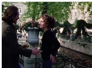
Incontri a Parigi (Les rendez-vous de Paris) Eric Rohmer, 1995

Film a episodi, interamente girato nei quartieri della capitale francese, ci racconta tre storie della vita sentimentale dei suoi protagonisti. Variazioni sul tema dell'amore messe in scena nei luoghi della città. Particolarmente interessante il secondo dal titolo emblematico "Le panchine di Parigi", che ci mostra in sequenza, gli appuntamenti di una coppia fissati esclusivamente nei parchi e nei giardini.