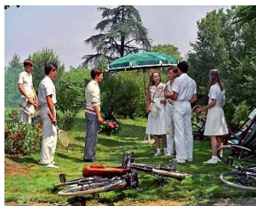
Il giardino dei Finzi Contini Vittorio de Sica, 1970

Un classico della letteratura rivisto da un grande regista: un passaggio tra testo e cinema difficile e complesso che ha sempre alimentato dibattiti molto accesi, soprattutto tra gli studiosi ferraresi. In questa rassegna, metteremo da parte per un attimo le vicende umane e lasceremo parlare la città attraverso uno dei suoi giardini, quello più famoso, quello che non c'è.